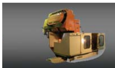
立形マシニングセンタ